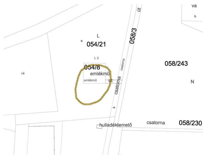
Templomrom, 2772, hrsz. 054/8