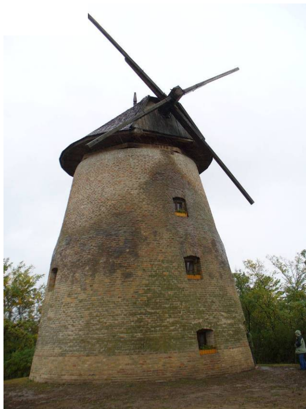
Szélmalom, 2771, 080/13